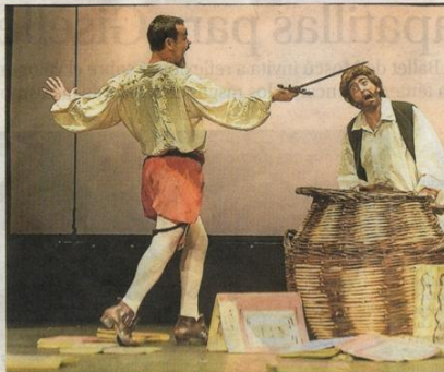
Momento de la puesta en escena de 'Quijote Aventuras'.

En cuanto a Quijote Aventuras , es una puesta en escena, inspirada en la dramaturgia del clown, de diferentes episodios del Quijote